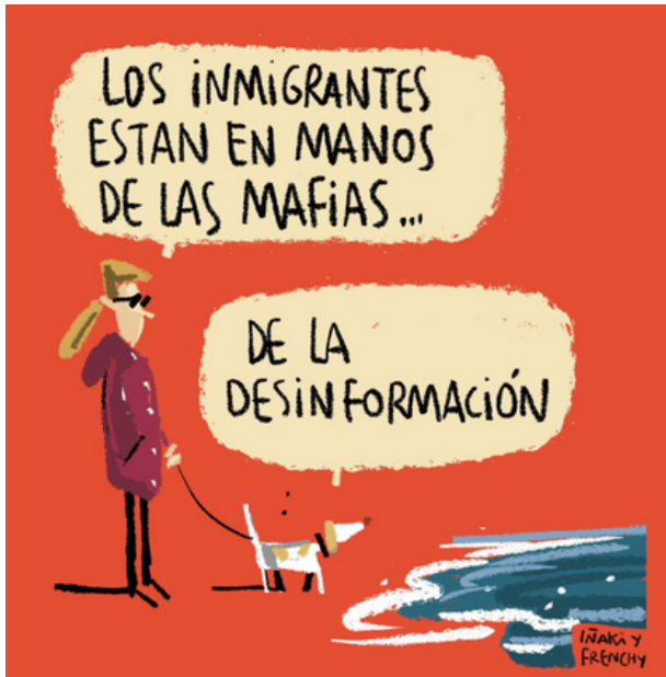
IÑAKI Y FRENCHY