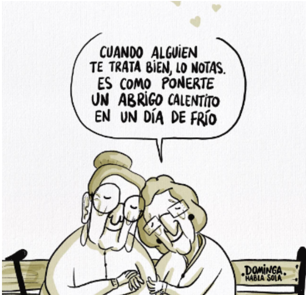
DOMINGA HABLA SOLA