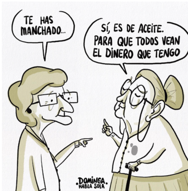
DOMINGA HABLA SOLA