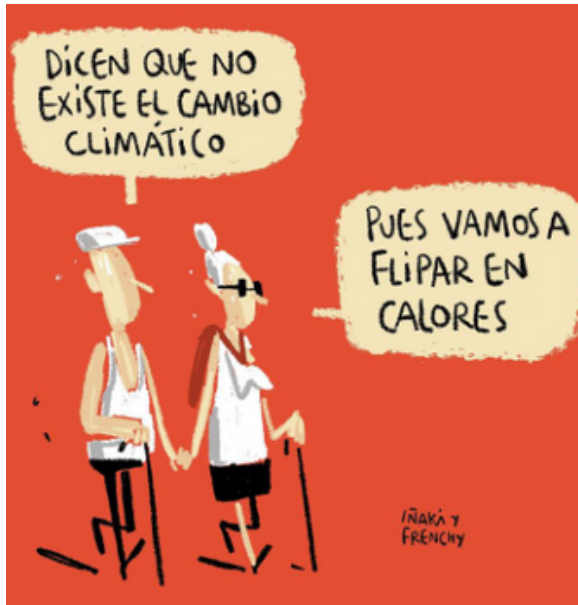
IÑAKI Y FRENCHY