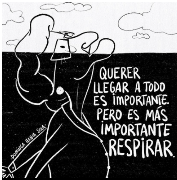
DOMINGA HABLA SOLA